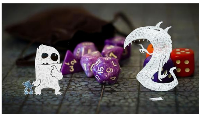
Plateau de jeu de rôle agrémenté des iconiques dés à multiples faces d4, d8, d20. Deux monstres du jeu «Petits détectives de monstres» se sont invités.

Par Valentin Paquot Publié le 14 septembre 2019 à 14:00, mis à jour le 17 septembre 2019 à 19:09