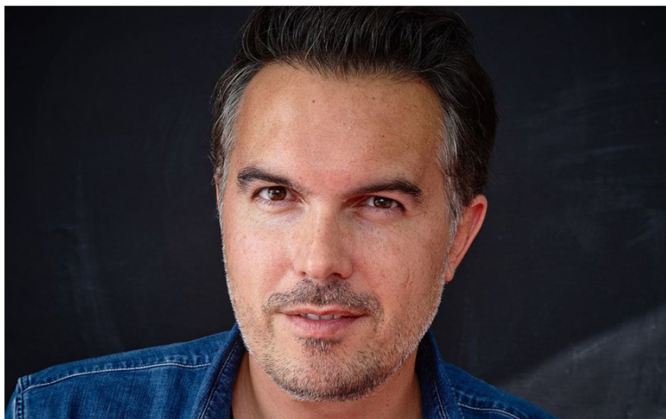
L'écrivain Maxime Chattam est fan de jeux de rôle et collectionne les dés.

LE PARISIEN WEEK-END. Echange SMS avec Maxime Chattam à l'occasion de la sortie d'un kit d'initiation du jeu « Chroniques oubliées : Cthulhu » dont il a signé le scénario.